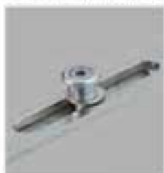
Serrure 4 gâlets