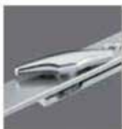
Pêne demi tour réversible