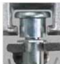
Gâche réglable en compression